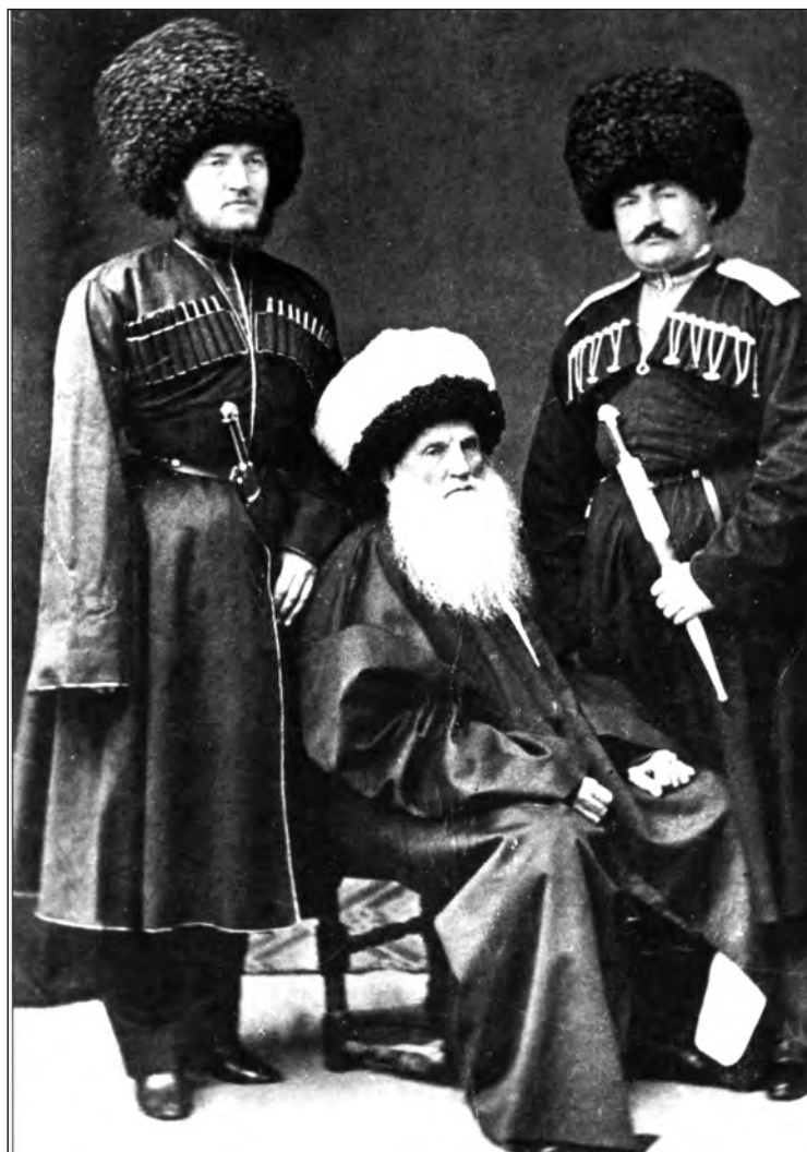
Шамил имам васалгун цадахъ. 1867 с.