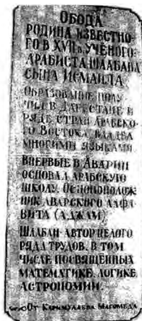
ГIобода росуль ШагIбан - къади ракIалде щвезавиялъул хIурматияб хъарщи.