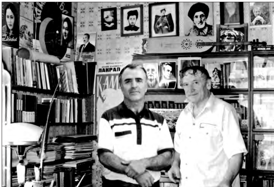
Махѹмуд - Апанди Гѹабасил Махѹамадгун

Ахѹмад ГѹАЗИЗОВ, медицинаялъул гѹелмабазул доктор, профессор.