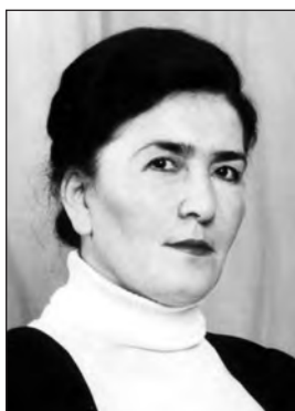
Дагъиста халкъла поэт Аминат ГИЯБДУЛМАНАПОВА