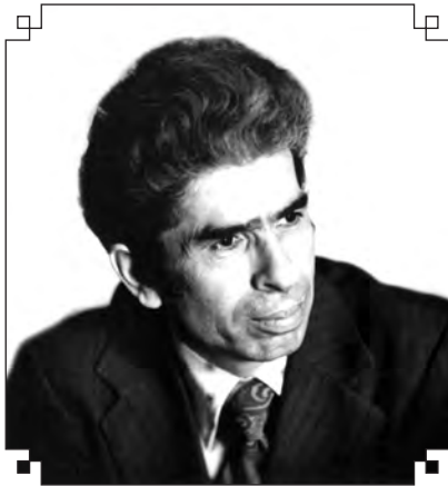
ДагӀиста халкӀла поэт Сулайбан РАБАДАНОВ

Ил гӀарли-марси халкӀлис дигуси, халкӀли марварибси поэт сай.