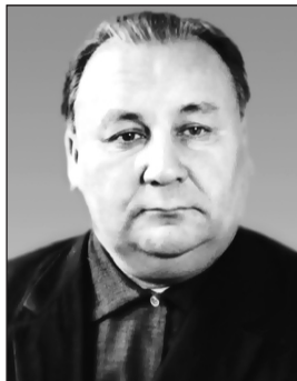
АТКБАЙ, Дагъыстанны халкъ шаири.