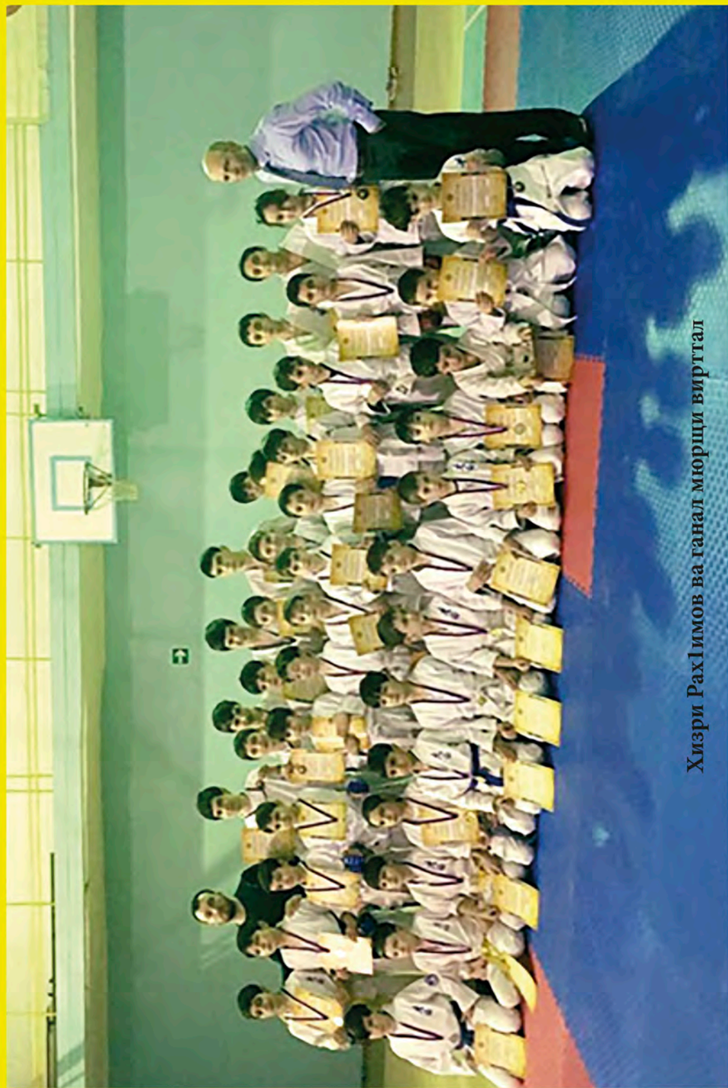
Хизри РахИимов ва ганал мюрци виртгал