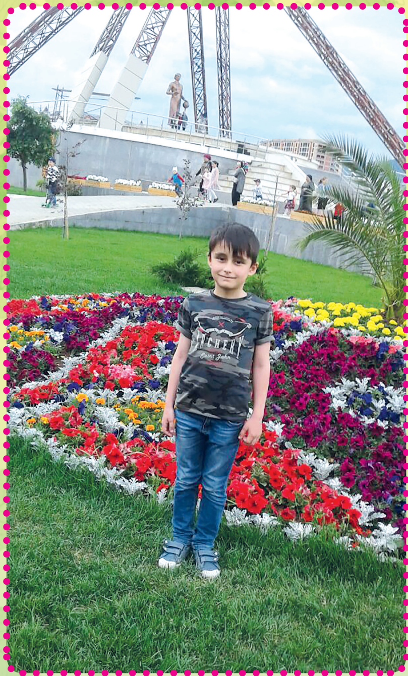
МяхІяммадов МяхІяммадли, МяхІячкъалала 9 - ибил школала 1 - ибил класс шула кьиматуначил Таманаиб.