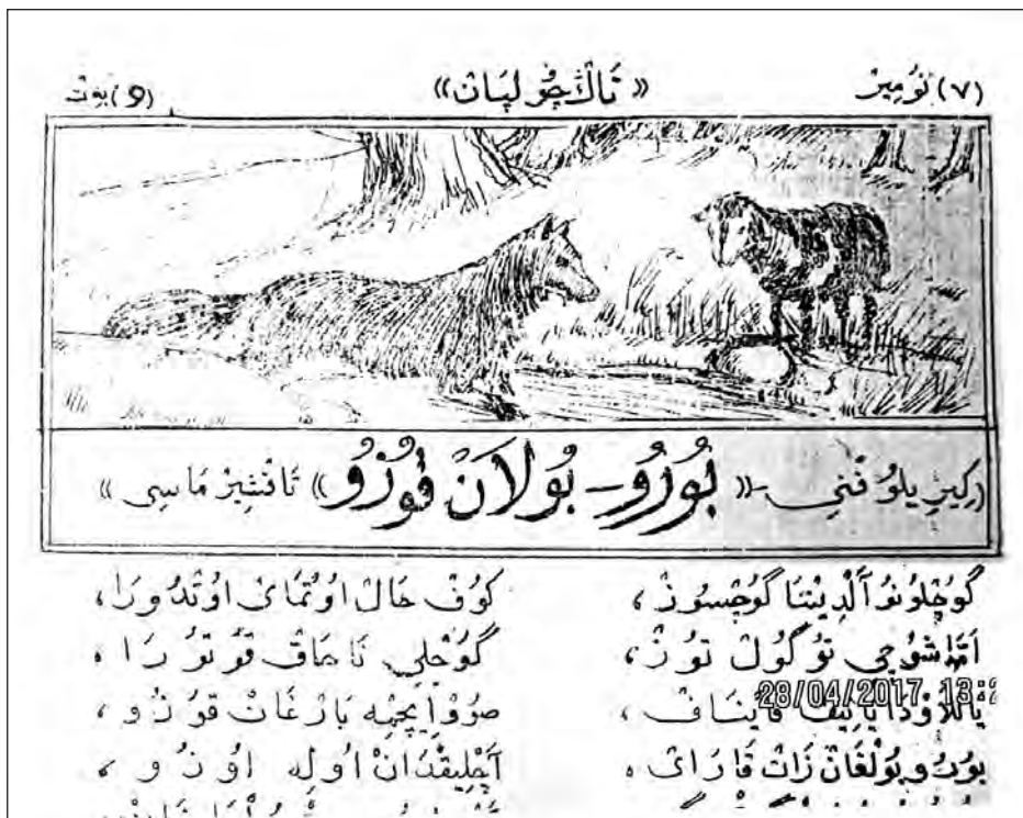
“Бёру ва кьозу” - И. Крыловну масалыны таржумасы

Зайналабит Батырмурзаевны ялынлы шиърулары булан башлангъан янгы кьумукъ адабият революция дагъытгъан эсги дюнъяны кьалды-кьулдулары булан ябуша туруп, халкъны эркинлигин ва насибин суратлай туруп оьсдю. Шо адабиятны биринчи асарлары революцияны, ол гелтирген янгы дюнъяны кьутлап ва макътап язылды.