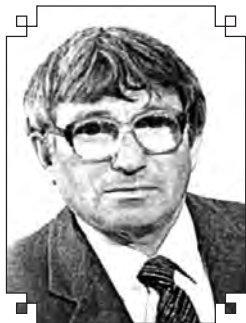
Магъаммат АТАБАЕВ, Дагъыстанны халкъ шаири.