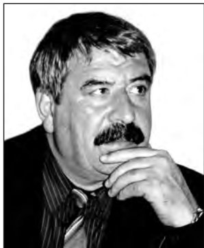
МахАаммад АХИМАДОВ, Дагъусттаннал халкъуннал шаэр