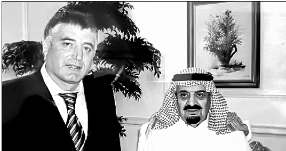
Абдул Абзиз бин Салманнушал - Саоьдинал МВД-лул министрнашал

- Ина к1улла политик х1исаврай, амма къак1улла спортсмен х1исаврай... - На Цуликъянив школалийва спортрахун агьссияв. Ттун ххирая ла- ч1ун уккан. Пединститутраву ккалайни боксрахун агьссияв, яла махъ ка- рателухун, дзодарахун агьссияв. Дзюдорал спортрал мастерда. На ивк1ра группа захвата х1адур байсса тренернугу, миннал хьунаманугу.