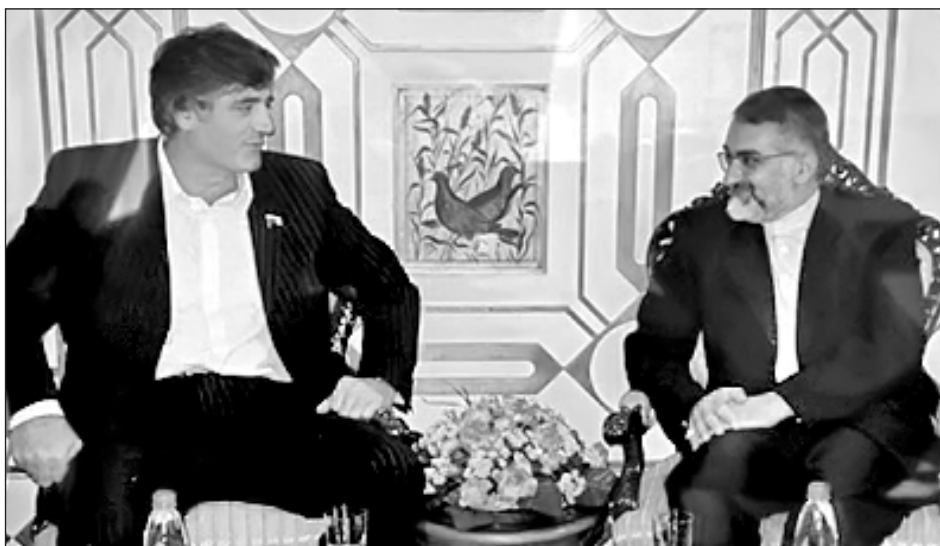
Ираннал Нигачаврилсса байсса мирза Мухаммадийнащал, Тегераннай

- На ивссара Индонезиянавун, Китайнавун, Индиянавун, цябала цаймигу мусульмантал бусса Азиянал ва Африканал билятирттайн. Ттун дакний ливчунни Раджеф Тайип Эрдоган, Муаммар Каддафи. На ура Муаммар Каддафинаясса дакнийн бичавурттал лу чичлай. Мукуна на ура ккалай геополитикалиясса лекцияртту МГУ-лул студентьтурахь, эксперт хлисаврай гуртту хьуссара цимивагу геополитикалун хас бувсса форумирттай. Цалчин нари бувсса Маскавлив Советирттал Къатлуву «Мусульмантал терроризмалйн кърщи букваву» тисса Международная конференция. Яла бувссия Махачкъалалив, Германиянаву, Италиянаву.