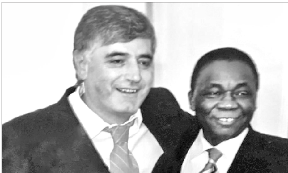
Африканал (Экваторианльнй Гвинея) Нигачаврил Маслихатрал мирзанащал

- На ивссара Индонезиянавун, Китайнавун, Индиянавун, цябала цаймигу мусульмантал бусса Азиянал ва Африканал билятирттайн. Ттун дакний ливчунни Раджеф Тайип Эрдоган, Муаммар Каддафи. На ура Муаммар Каддафинаясса дакнийн бичавурттал лу чичлай. Мукуна на ура ккалай геополитикалиясса лекцияртту МГУ-лул студентьтурахь, эксперт хлисаврай гуртту хьуссара цимивагу геополитикалун хас бувсса форумирттай. Цалчин нари бувсса Маскавлив Советирттал Къатлуву «Мусульмантал терроризмалйн кърщи букваву» тисса Международная конференция. Яла бувссия Махачкъалалив, Германиянаву, Италиянаву.