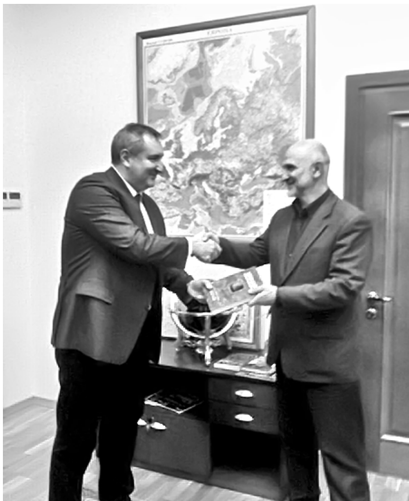
Ж.М.Хачилаев ва Д.О.Рогозин