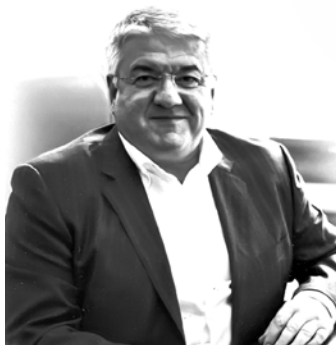
Абдулмажид МАХРАМОВ, Аьрасатнал Госдумалул депутат