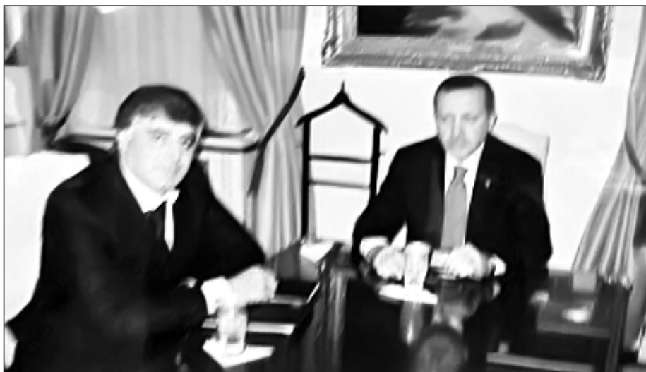
Маммаев Мамма Раджеф Тайип Эрдоганушал, 2006ш. Анкяла

- Х1урмат бусса, Мамма Нурмах1аммадович, ина ура ц1а дурксса политик ва ишбазаранчи. Ина ивк1унна Дагъусттаннал Жяматийсса Дастгалугърал членну, Госдумалул депутатну, Нигъач1аврилсса байсса комитетрал хъунаманал хъиривчуну, Данди бац1аврил комитетрал кьют1сса бюджет ххал бигъайсса ва Миллат буруччаврилсса байсса комиссиялул членну. Махъсса ппурттуву ина чувч1ав кьуллугърай акъаяв. Му цукунни бувч1ин аьркинсса?