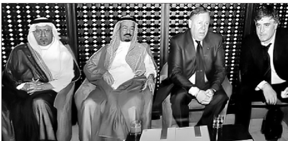
Саоьдинал торгово-промышленный палаталуву Аьрасатнашал вакилнашал (киях Саоьдинал паччах1)

- Вил игьалансса ч1уннагу лич1айрив? Му цукун гьан дуvara?