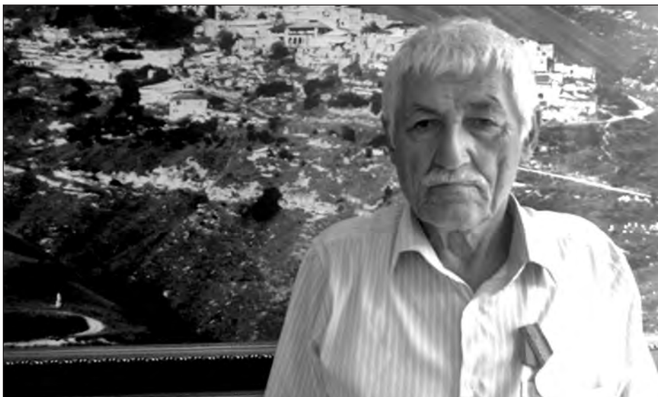
Кіамахъаллал шяраваллил суратрачІа Абдуллаев Х.М.

- Халид МахАммадович, ина ци шинал, чув увссара?