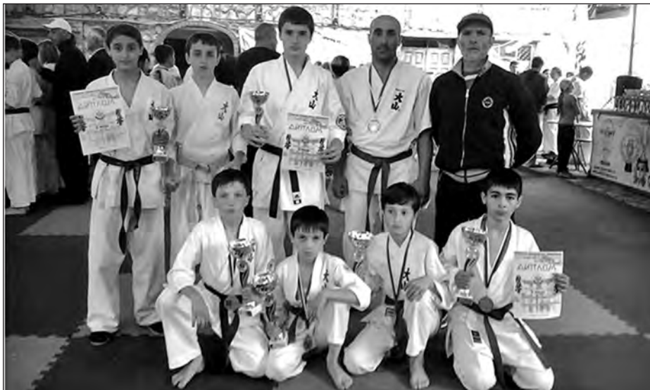
Ояма карателулул школа