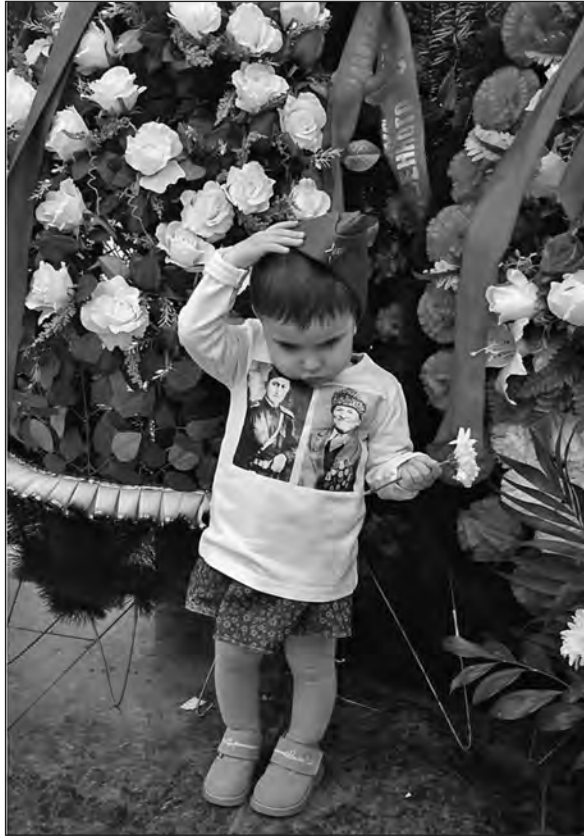
Душил душнил душ Асия