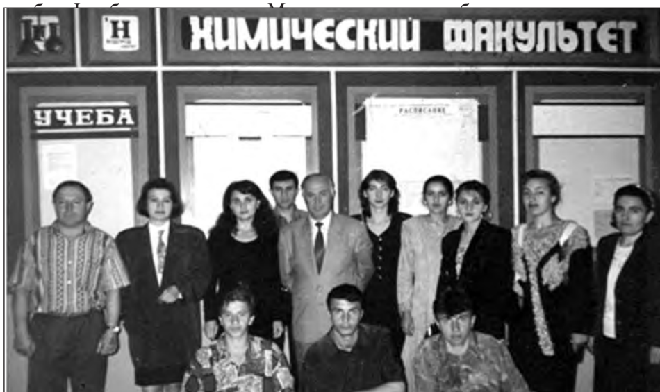
ДГУ - рал химфакрал студенттурацал

Буттан ххирая Лакку кIану. Ганал жу буцайвав зунттал мицIайн, ардайн. Жу датIайссияв уртту-тутIи. Лахъайссияв гъалаксса нехру. ХъхъичI бивхъусса хиялданучIан, захIматшивурттах бурукъавгун бачин аркинши-