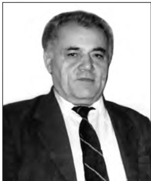
Мирза ДАВЫДОВ, Дагъустаннал халкъуннал шаэр