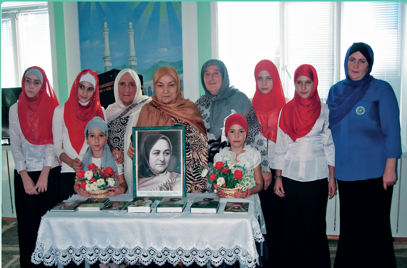
церехъабазул хІакъалъулъ хъварал рахъана Ленинкент поселокалъул, тІахъалги. Къамыш ва Кирпич гъутаназул, ЧІахІиялго гІадин, Машидатил гъединго Генуб росдал школазул рагІабазда кучІдул цІализе цере цІалдохъаби.