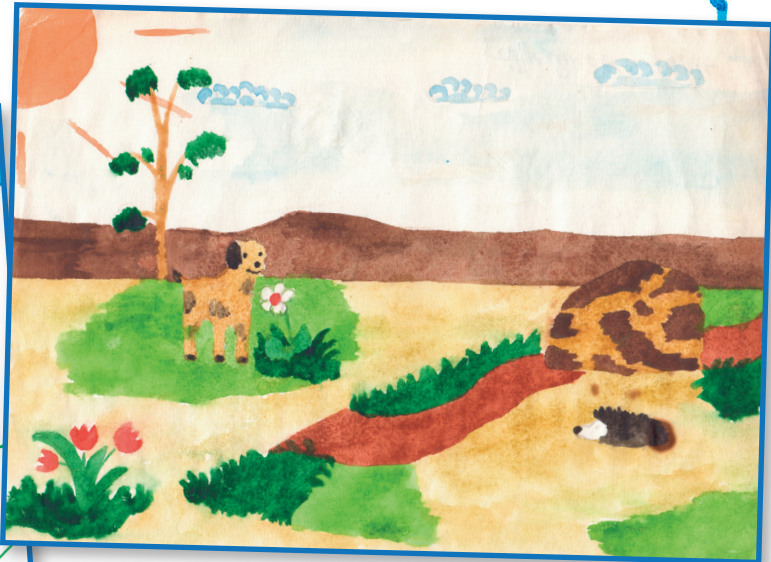
Гъусейнов Хизри, 6 кл.