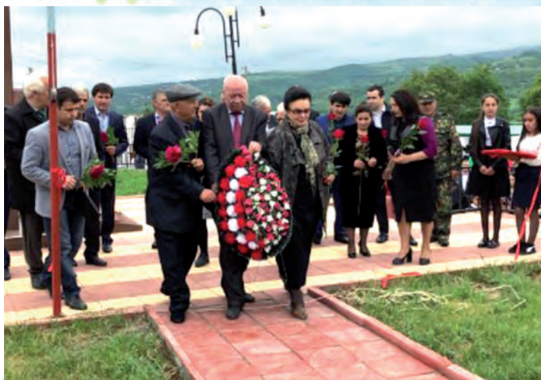
Даттларин Уруждин гюмбет ачмиш апГурайи мяракайиъ.