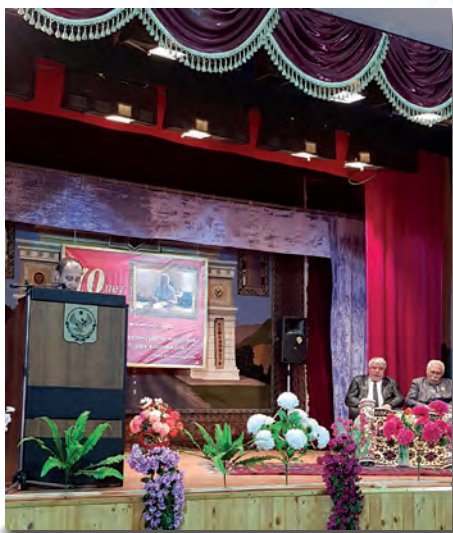
Ш. Шагьмардановдин 70 йисаз тьялукь вуйи мяракайиъ.