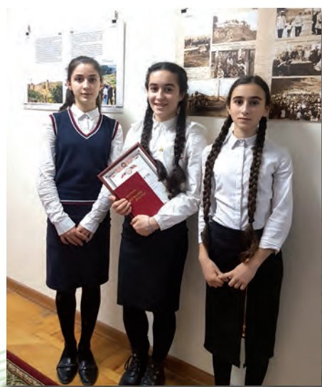
Шиърар урхрударин конкурсдин иштиракчийир.