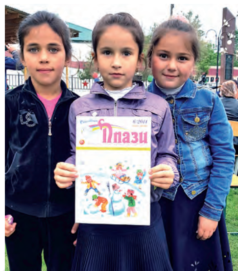
«Плази» журналин дустар.