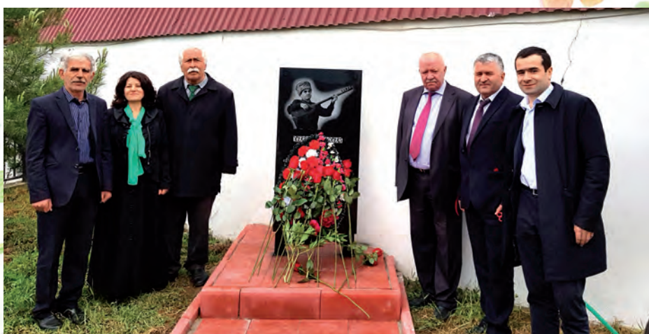
Даттларин Уруждин гюмбетдихъ.