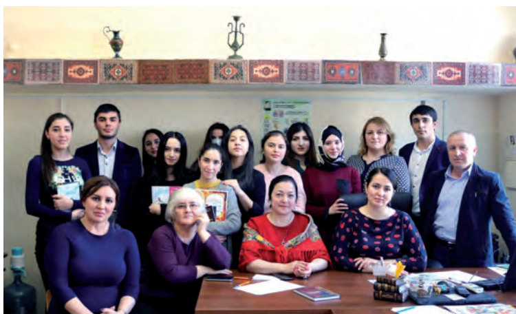
ДГУ-йин ва ДГПУ-йин студентарихъди.