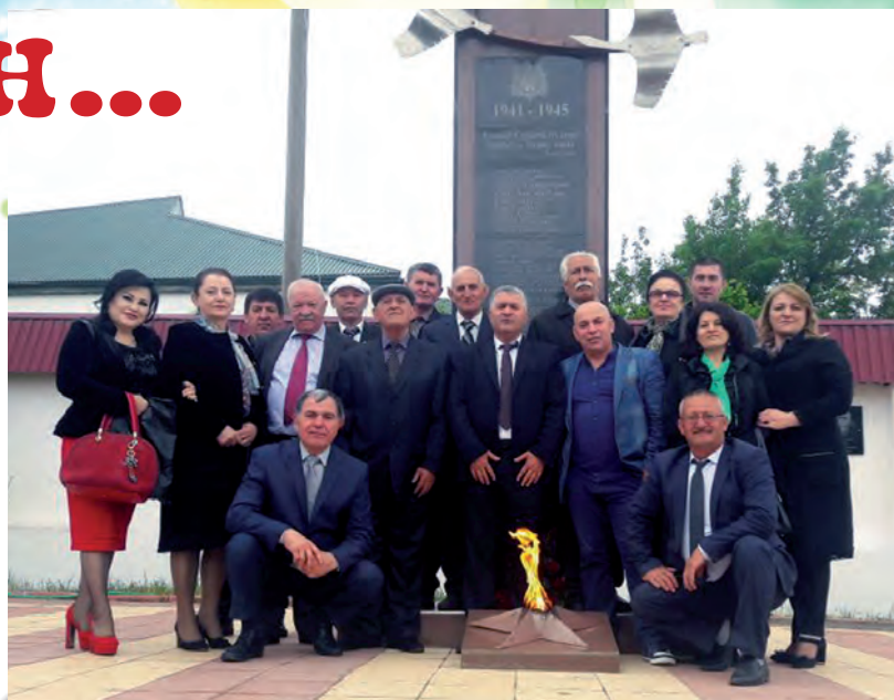
Даттларин гьулан «Лизи кьарнийир» гюмбетдихъ.