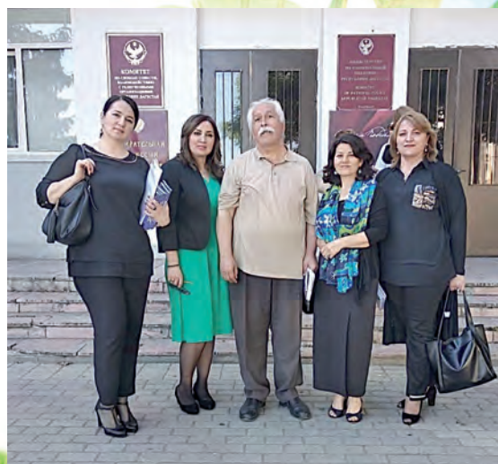
Дагъустан писателарин антологийрин презентацияиъ.