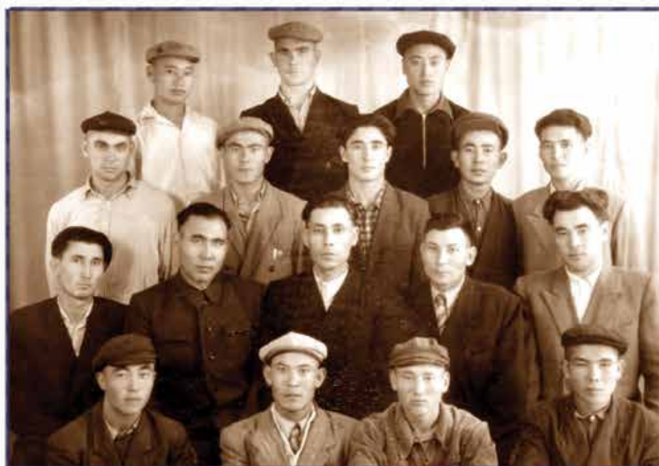
Гамзат Армияга кетеектен алдын