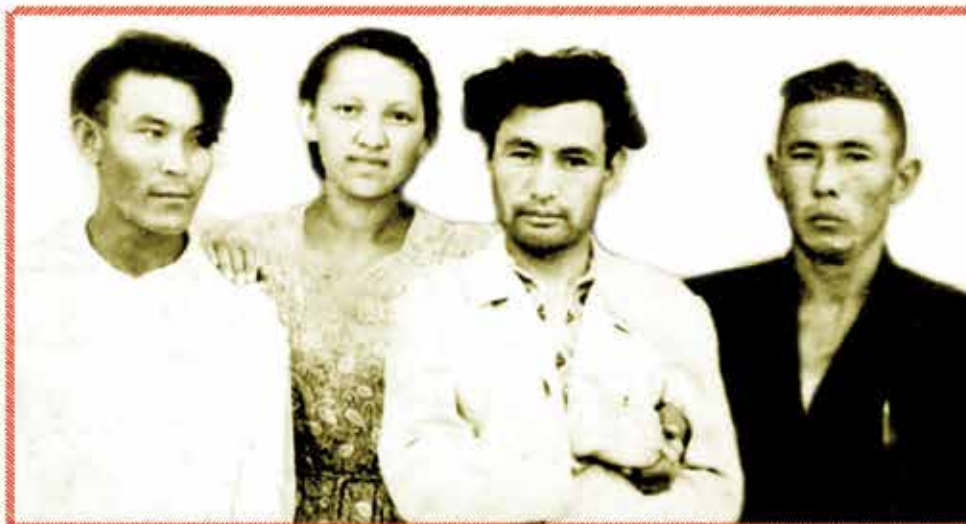
Орта школадынъ ызгы йылы, 1957 й.