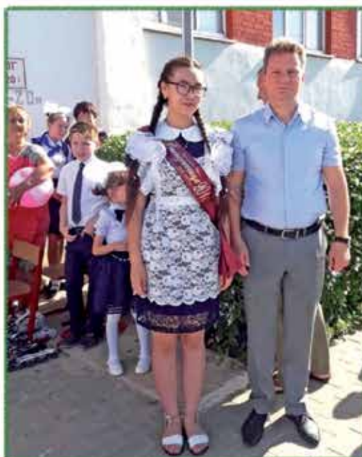
Айгуль эм билим министри Джувалаков