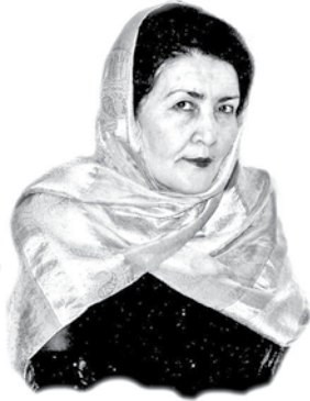
Дагъиста халкъла поэт Аминат ГИЯБДУЛМАНАПОВА