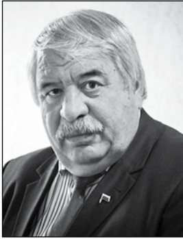
Магхаммат АГЪМАТОВ, Дагъыстанны халкъ шаири