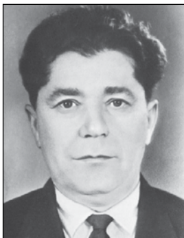
Анвар ГЪАЖИЕВ, Дагъыстанны халкъ шаири