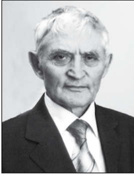
Абдулла ДАГЪАНОВ, Дагъыстанны халкъ шаири