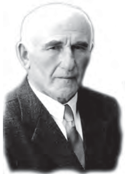
Расул БЯХИЯММАДОВ, Дагъиста халкъла писатель