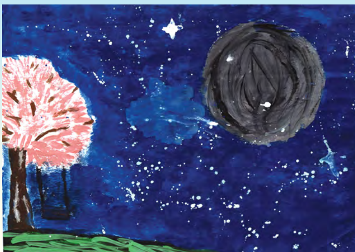
Ибрагим Абдуллаев, лицей № 8, Магъачкӱала