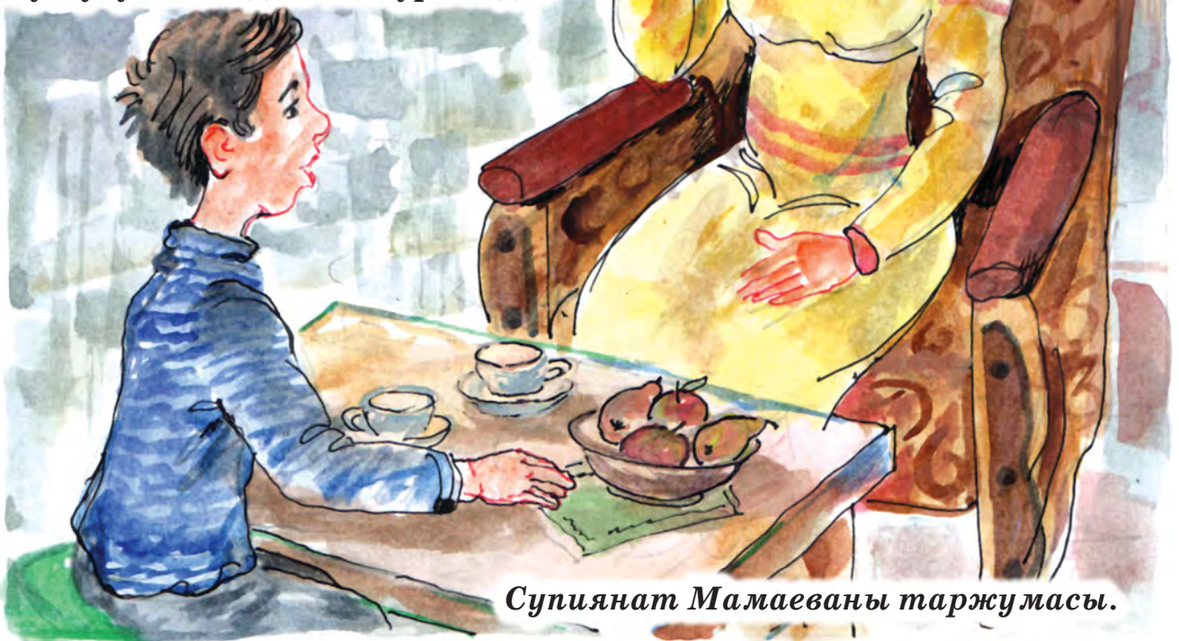
Супиянат Мамаеваны таржумасы.

– Неге тюгюл, бизин яратгъан Худай, Ругъубуз имандан толтура онда.