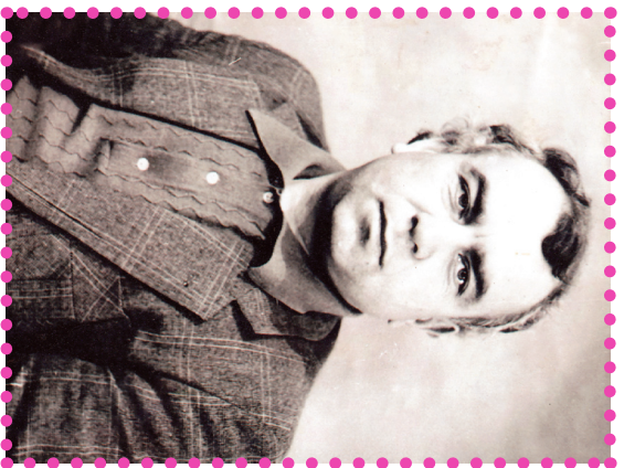
Милатран ххиңрасса шаэр

Ттул члавами дустан, нажатълий ттухъ- ва цѣуххирича, шаэр цури куну, на укунсса жаваб дулувиыв: