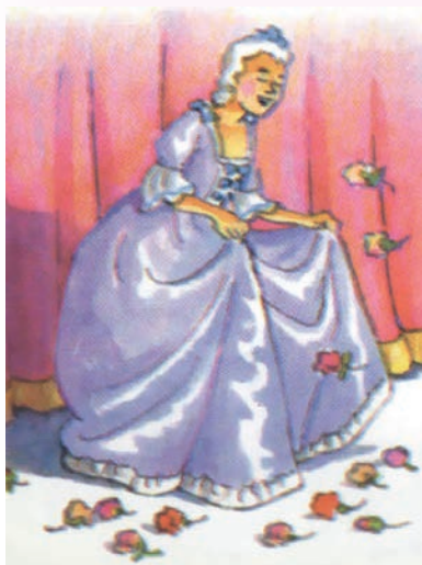
Рисунок на обложке уч-ся ДШИ пос. Дубки (Унцукульский район) Мусаевой Гулишат «Горянка»

Опера – очень серьезный музыкальный жанр. Разговор о ней мы обязательно продолжим в следующих номерах журнала.