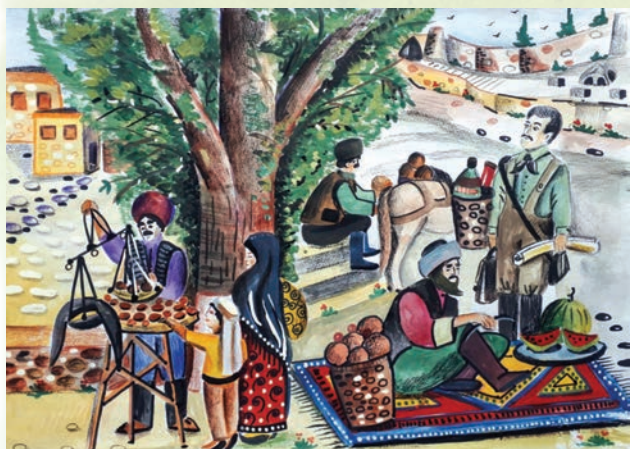
Хадижа Рагимова, 14 лет, СОШ №14 г.Дербента: 2 место в старшей группе