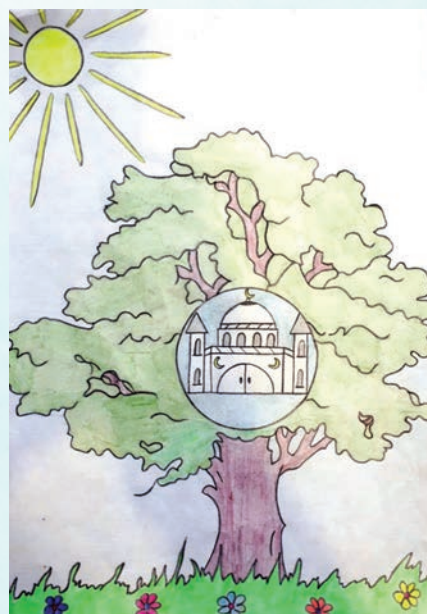
Казали Нурмагомедов, 8 лет, гимназия №3 г.Дербента: 3 место в младшей группе