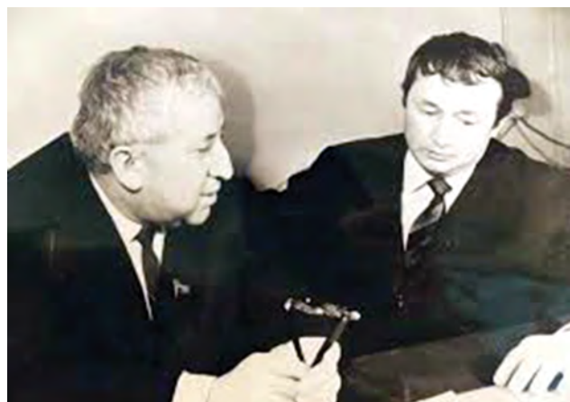
С Расулом Гамзатовым