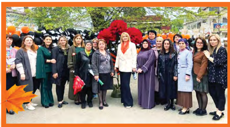
Учителя гимназии № 1 г. Махачкалы

Свету, чуткости, правде учите Наши души и наши умы. Все, что в жизни вы нам зададите, Постараемся выполнить мы.