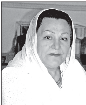
Шейит-Ханум АЛИШЕВА, Дагъыстанны халкъ шаири