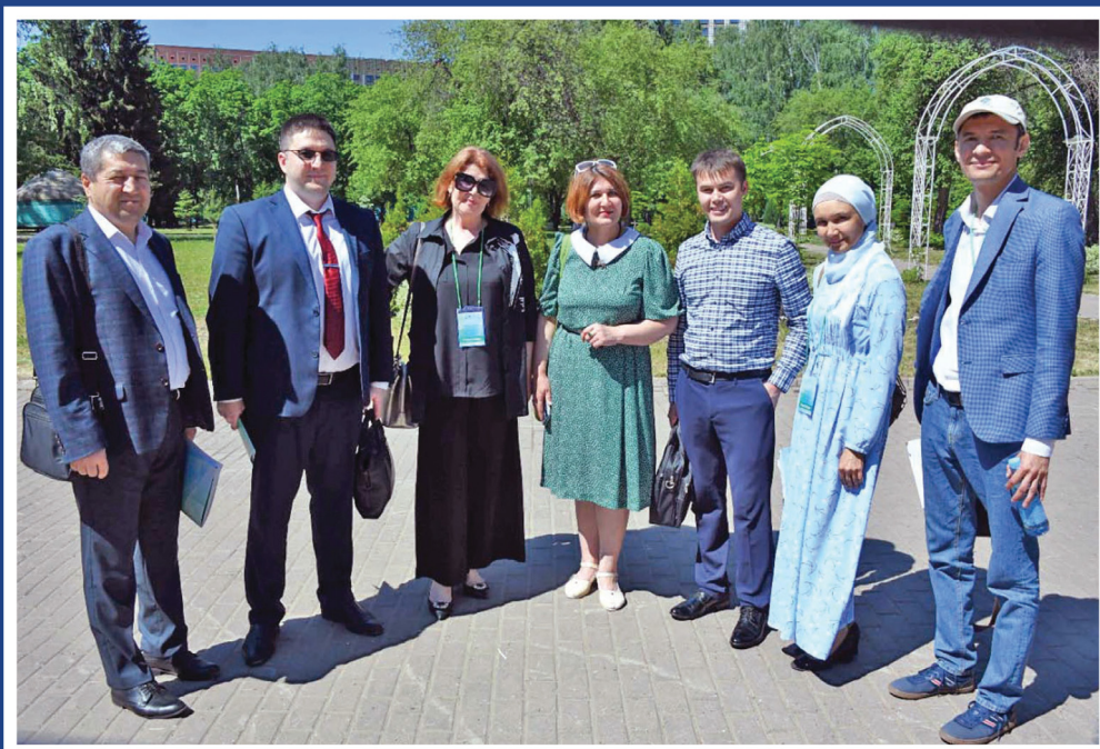
«XXI асруну язывчулары» деген форумну ортакчылары. Уфа.