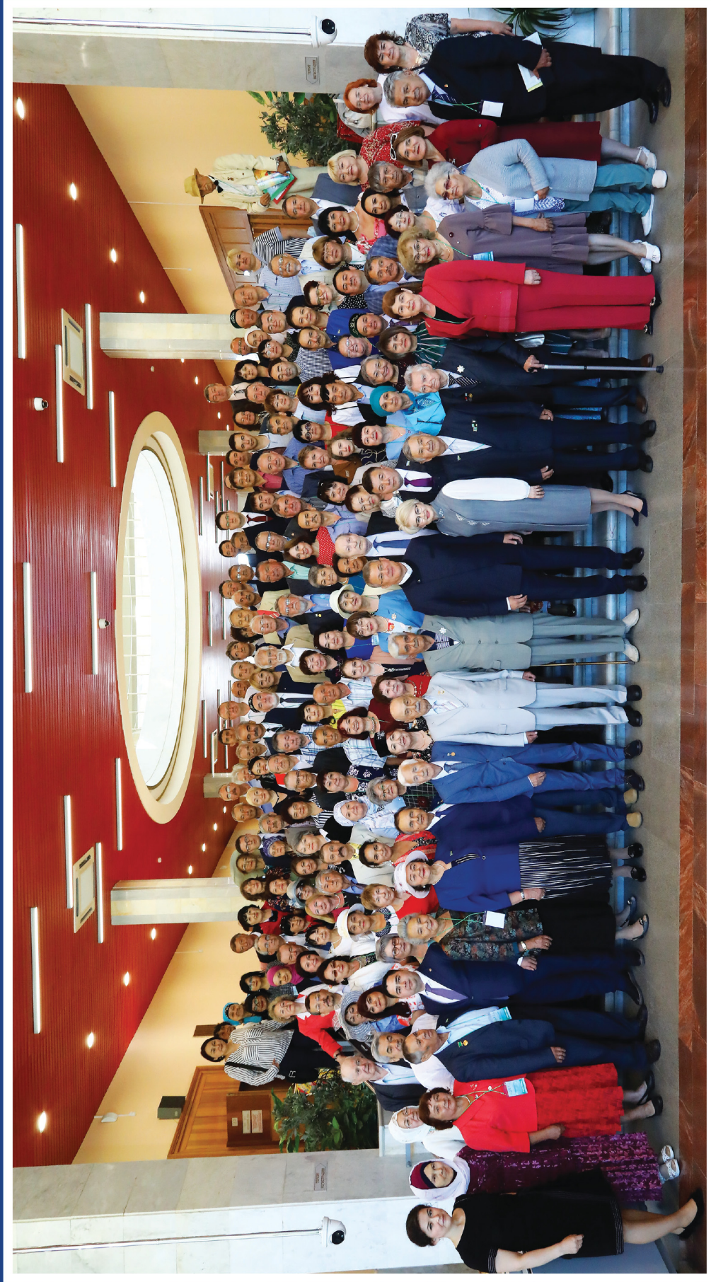
Форумдан эсделикте чыгарылгъан сурат.