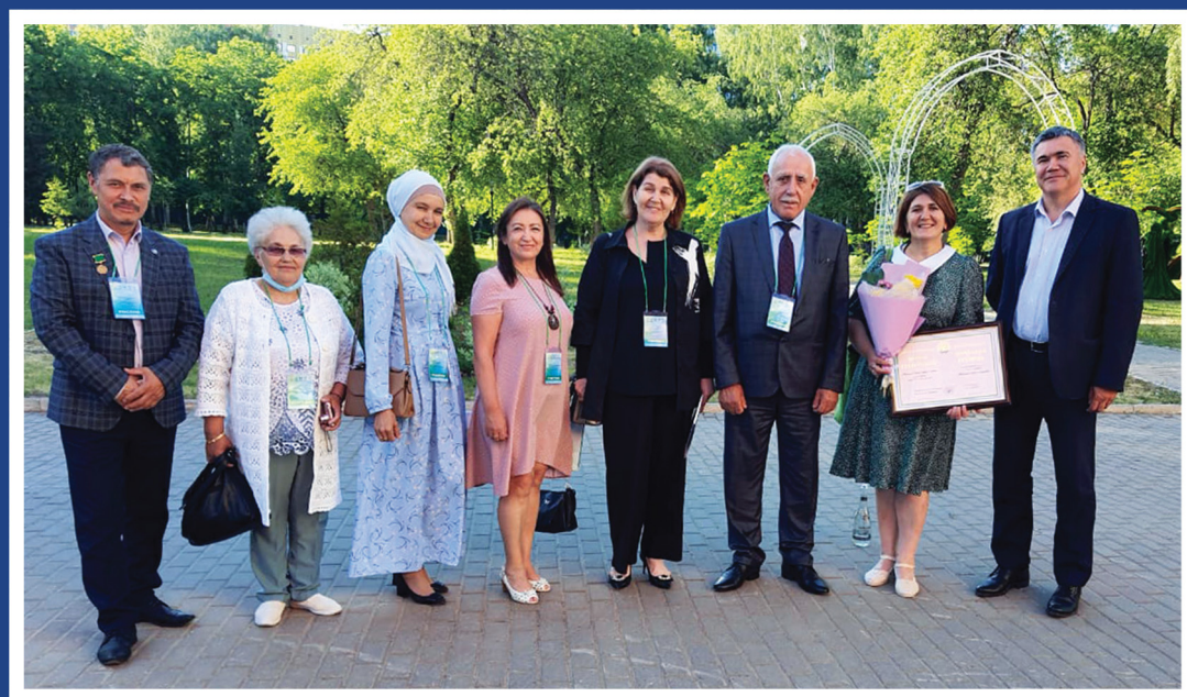
«XXI асруну ызывчулары» деген форумну ортакчылары. Уфа.