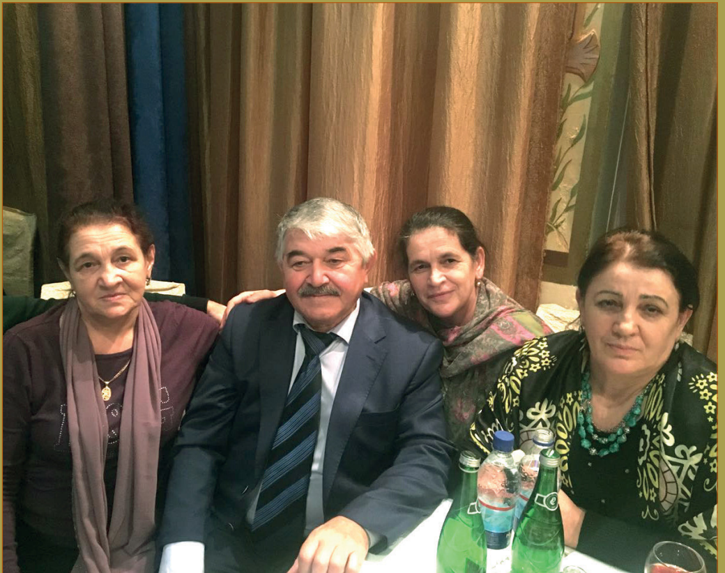
А. Исмаилов вахарин, рушарин ва хтулрин арада.