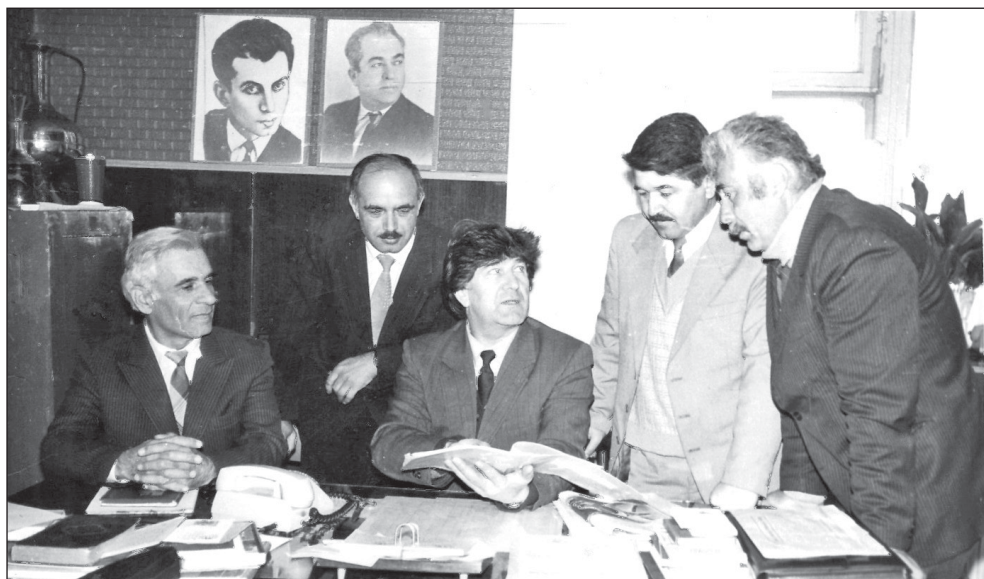
“Квал хъиткъинна” тамаша эцигзавайла.

«Зиярат» тамаша иллаки къейд ийиз жеда. Авторди, кIусни кичIе тахъана, дин-имандин месэлайрикай, муъмин касди хъиз, миxьи рикI гваз, амма пара хциз кхъизва. ИкI тирди сифте шикилдилай эхиримжидал кван сегънедин персонажар тир Малайикдини, Иблисди (Шейтанди) тестикъарзава.