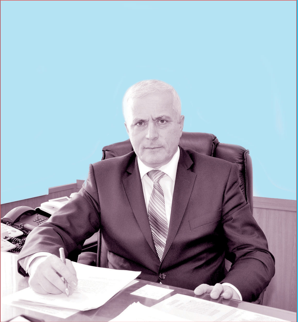
Джанибек Юнусович СҮЮНОВ, белгили политик, зегенли басшы