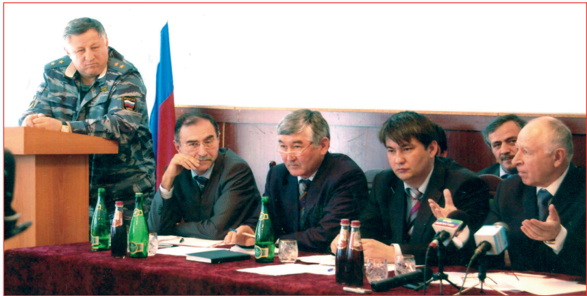
РД Президенти М.Г. Алиевтинъ Ногай районга келуви, 2009 йыл