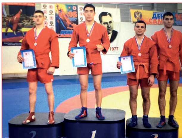
Санкт-Петербург каладынъ MMA чемпионы