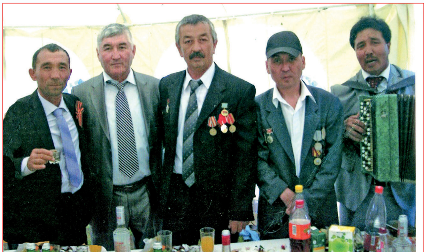
Н.К. Мансуров йолдаслары ман Енъуьв куйинде