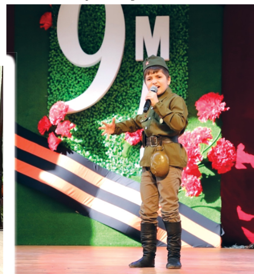
Фестиваль-конкурс «С песней к Победе»