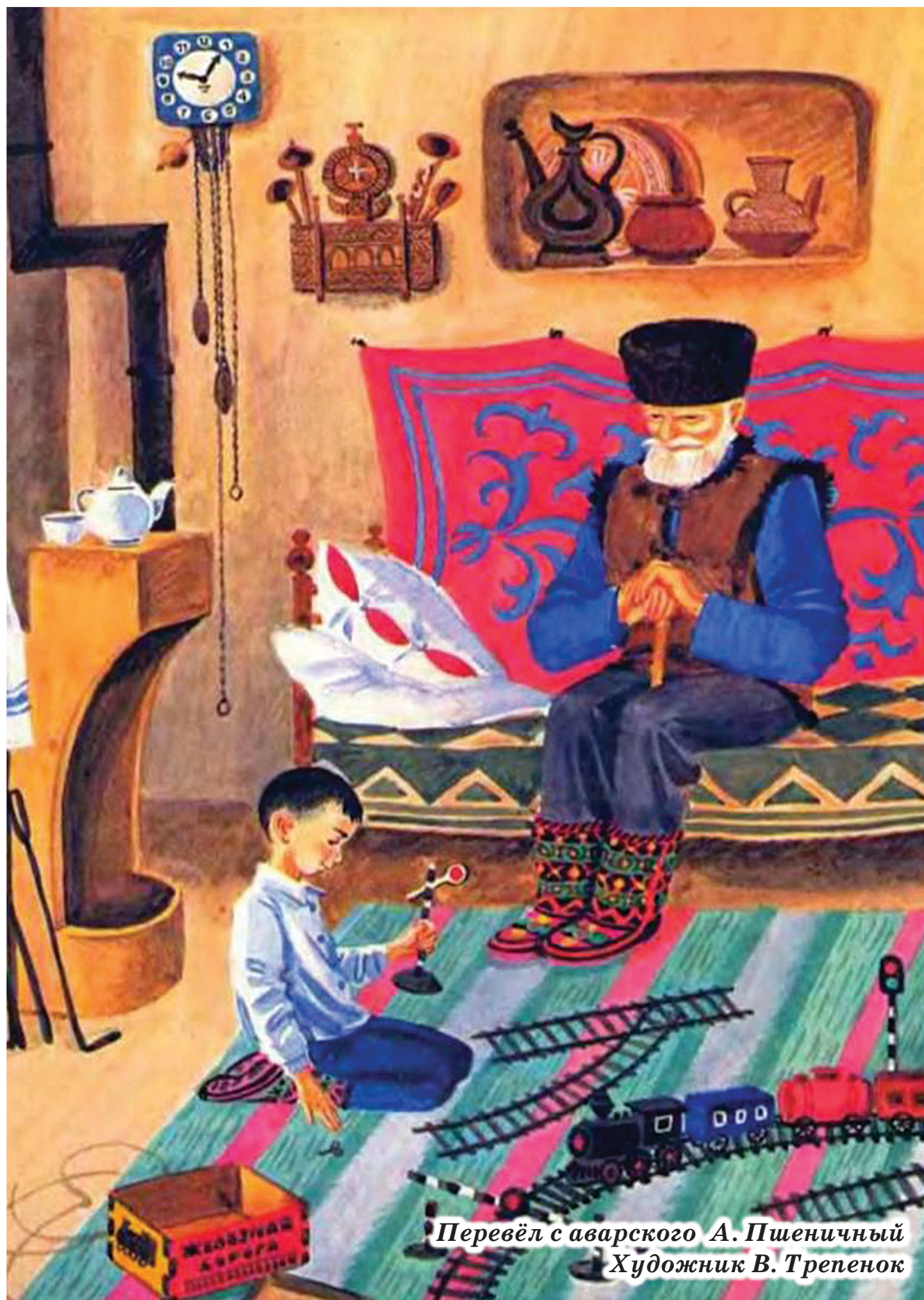
Перевёл с аварского А. Пшеничный Художник В. Трепенюк