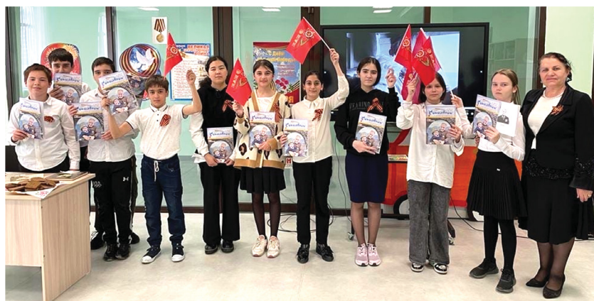
Каспийский центр образования «Школа № 15»