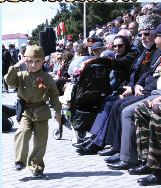
Парад Победы в Каспийске