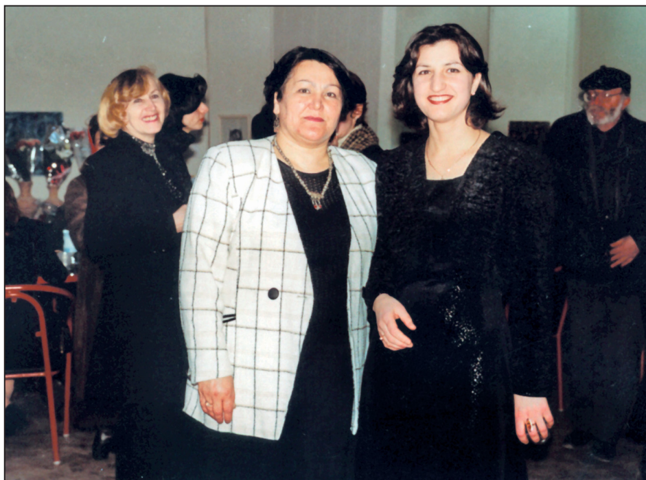
Къызы Жавгъарат булан.