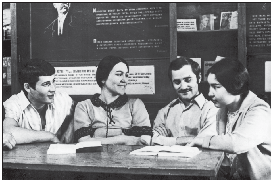
Адабият институтда охуйгъан заманы.