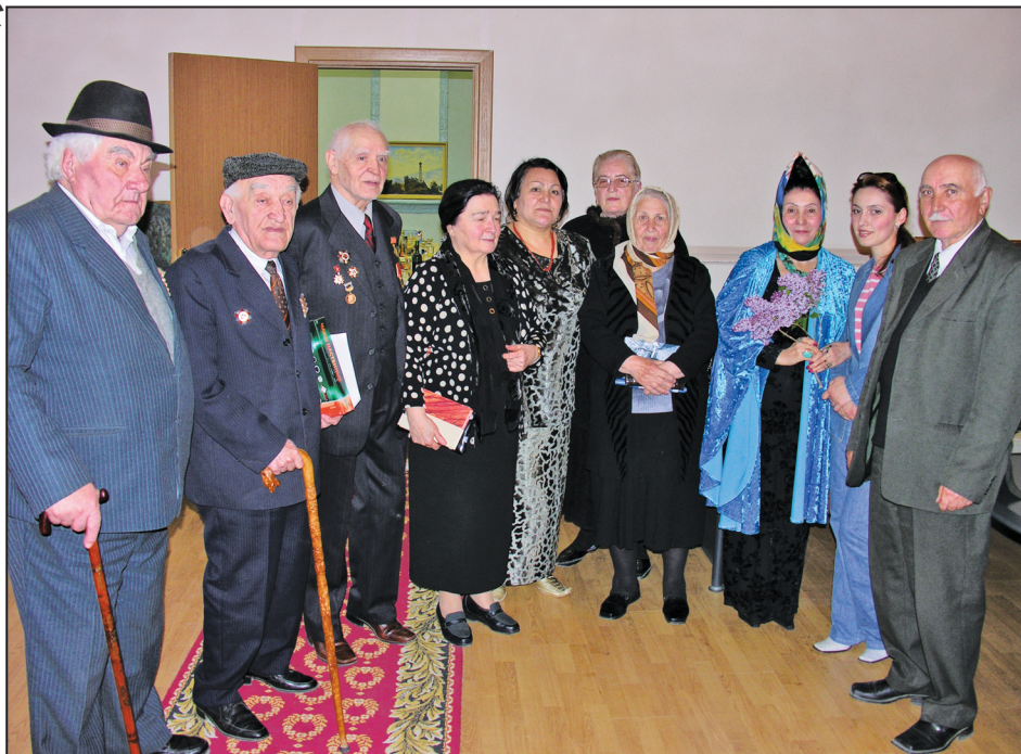
Дагъыстан язывчулары булан.