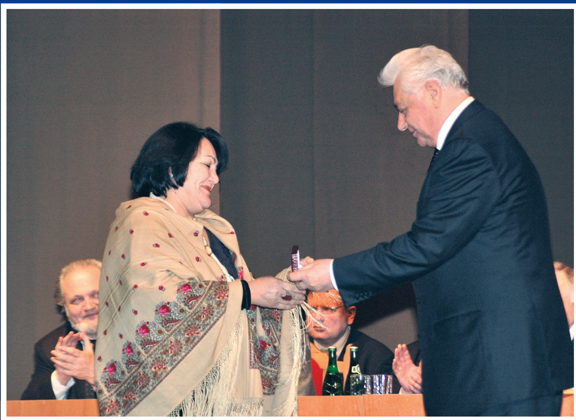
Пачалыкъ савгъатын тапшурагъанда.