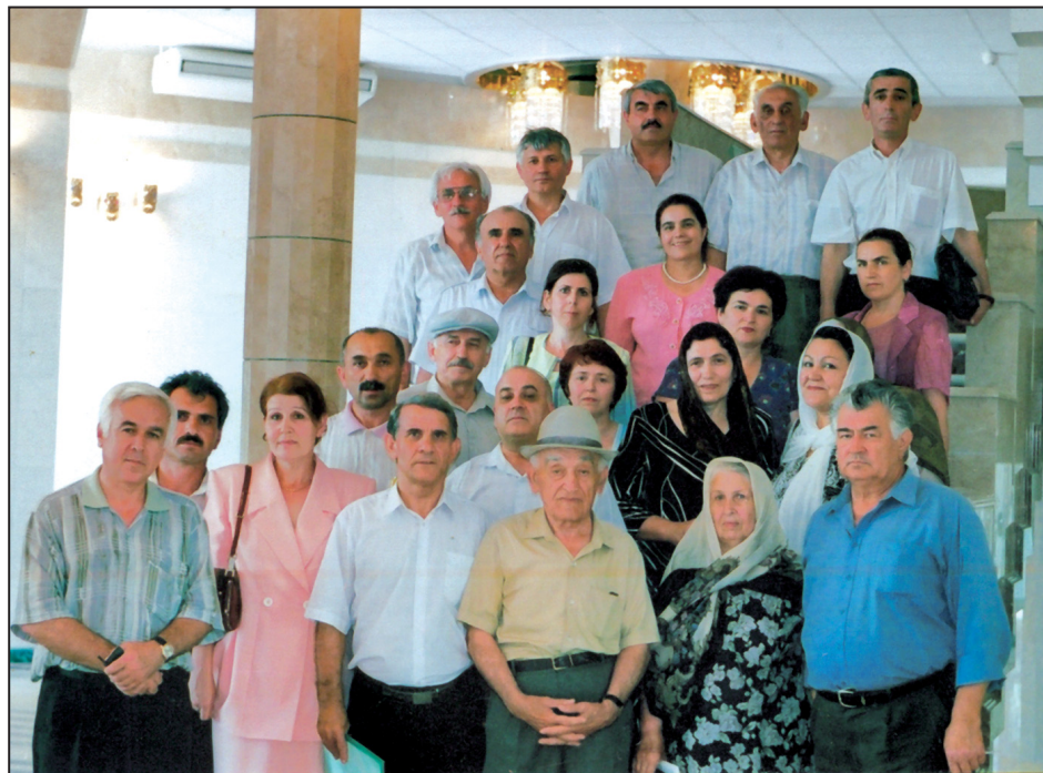
Къумукъ язывчулар Къумукъ театрда.