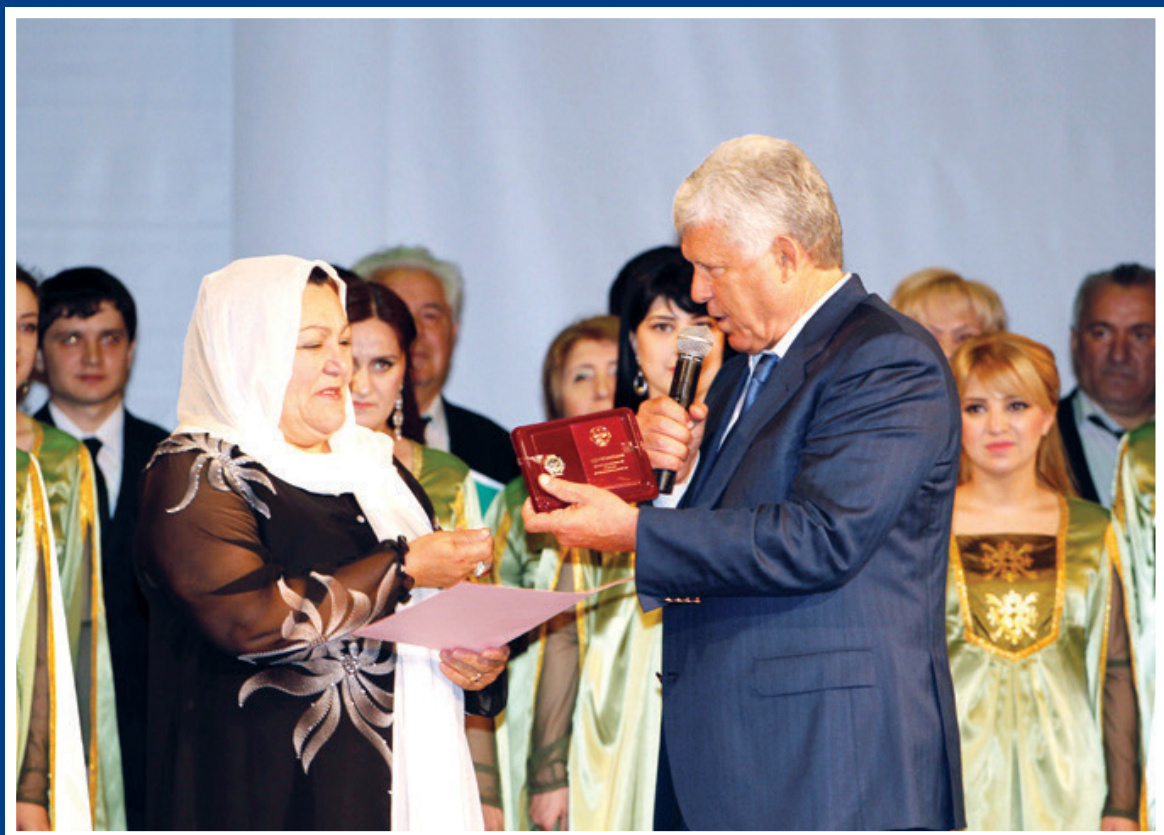
Дагъыстанны халкъ шаири деген ат бергенде.